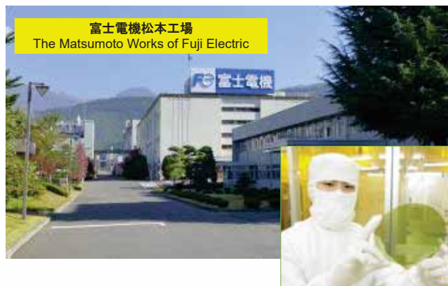
富士電機松本工場 The Matsumoto Works of Fuji Electric