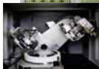
X線トポグラフィ装置の製品化 (株)リガク