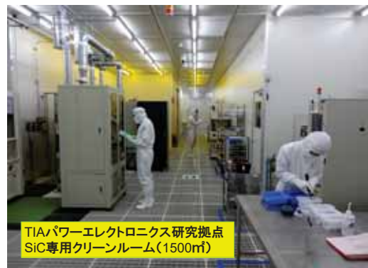
TIAパワーエレクトロニクス研究拠点 SiC専用クリーンルーム(1500m 2 )

Typical Outcome from the R&D Activities in TPEC