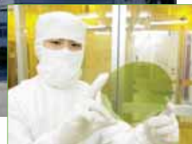
SiCデバイスの6インチ製造ラインを富士電機に構築 SiC Powerdevice Production Line constructed by Fuji-Electric