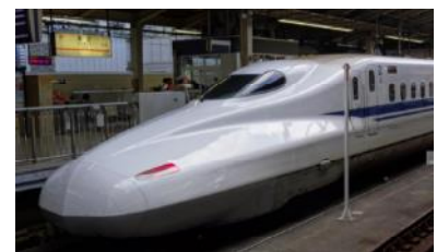
東海道新幹線N700系車両向け搭載 SiC/パワー半導体モジュール (2015年6月、富士電機)