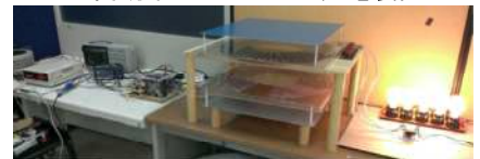
IEEE.IFEC 2015 Final Competition 第3位入賞 (大阪工業大学チーム)