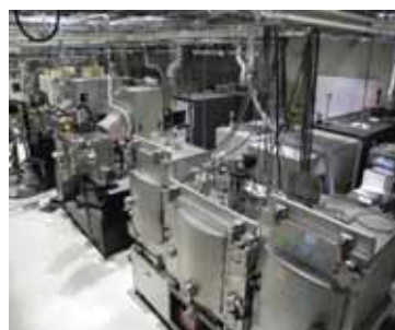
高温超電導線材作製装置群

I_c 測定装置(ゼロ磁場&磁場中), TapeStar™, 磁気光学装置, 磁化測定装置など