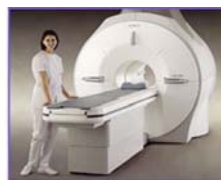
MRIマグネット (従来製品の一例)

【委託先】三菱電機株式会社、産総研、(NIMS) 【委託先】古河電気工業株式会社、(NIMS) 【事業期間】2016～2020年度（5年間）