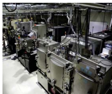
高温超電導線材作製装置群

I_c 測定装置(ゼロ磁場&磁場中)、Tapestar™、磁気光学装置、磁化測定装置など